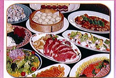
料理写真はイメージです。